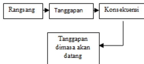
Gambar 2.1 Proses Pembentukan Perilaku